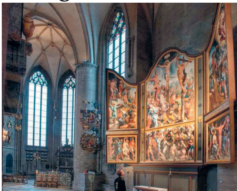
Kathedraal Linköping met Laurentius-altaarstuk.

Maarten van Heemskerck, één van de belangrijkste renaissancekunstenaars van de Nederlanden, maakte tussen 1538-1543 een immens kunstwerk voor de Grote of Sint-Laurenkerk: het zogenoemde Laurentius-altaarstuk. Dit is het grootste beschilderde altaarstuk ooit in de Nederlanden gemaakt. Na de Reformatie verloor het echter zijn functie; in 1581 werd het dan ook verkocht. Via een tussenpersoon kwam het in handen van de koning van Zweden, die het in de kathedraal van Linköping plaatste. Daar staat het nog steeds. De zijluiken wor-