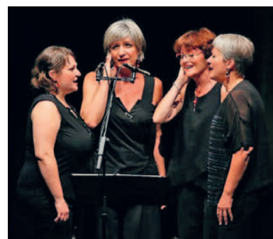
Madamicella kwartet.

ALKMAAR - Het Madamicella kwartet zingt donderdag 12 april om 20.00 uur Corsicaanse polyfonische liederen in de Lutherse kerk aan Oude Gracht 185-187. De meerstemmige zangtraditie van het eigenzinnige eiland Corsica behoort tot de mooiste en meest geliefde muziekstijlen van Europa.