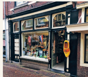
Het karakteristieke winkeltje Boom.

onderdelen; Egbert Broers, tabakswaren; J. Bruin en Zn, snoepgoed; Sünders, manufacturen; Tjeertes, hoeden en petten; De Vries, grutterswaren; Pels, wijn en gedistilleerd. En toen ook al Boom, klompen, touw en borstels. Alleen Boom bestaat nog. Blijkens hun webwinkel op tijd gemoderniseerd om het nog lekker 'ouderwets' te kunnen volhouden. Er kwamen na 1985 gelukkig ook veel nieuwe specifieke, karakteristieke winkels bij. Alkmaar geldt als gezellige winkelstad. Ondertussen is de leegstand verontrustend. Vooral in de fraaie kleine straatjes, waar winkels lang leeg staan. "Niet zo vreemd", maakte een ondernemer me wijzer. "Er lopen hier teveel graaiers rond, die zo maar na het aflopen van een contract de huur verduubelen. Dan jaag je de kleine winkeliers de stad uit." Alkmaar moet ze koesteren, die bijzondere winkels. Ze zijn de smaakmakers voor het publiek. Boom laat zien: ouderwets gezellig is aantrekkelijk. Stadsbestuur, let op uw zaak.